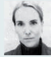
Emmanuelle CORTOT-BOUCHER Maître des requêtes, Rapporteur public CONSEIL D'ÉTAT